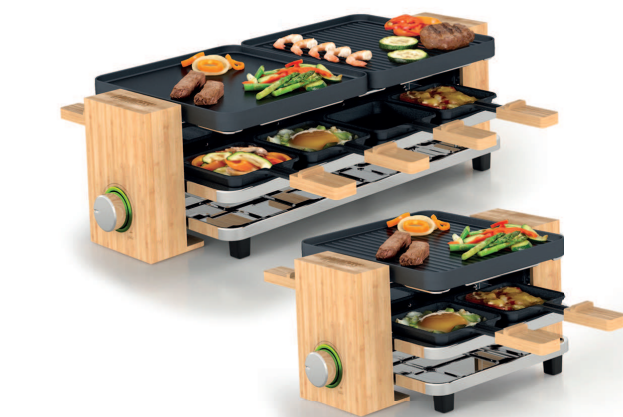
Raclette Pure 4 / Raclette Pure 8 01.162900.01.001 / 01.162910.01.001

PARTS DESCRIPTION / ONDERDELENBESCHRIJVING / DESCRIPTION DES PIÈCES / TEILEBESCHREIBUNG / DESCRIÇÃO DE LAS PIEZAS / DESCRIZIONE DELLE PARTI / BESKRIVNING AV DELAR / OPIS CZĘŚCI / POPIS SOUČÁSTÍ / POPIS SOUČASTÍ / OSÍEN KUVAKUSET / BESKRIVELSE AF BESTANDDELE / BESKRIVELSE AV DELER