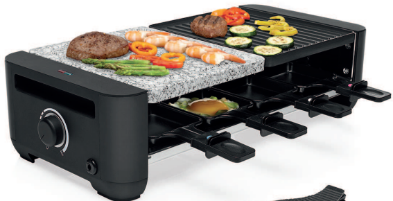
Raclette Premium Grill & Stone 01.162619.01.001

PARTS DESCRIPTION / ONDERDELENBESCHRIJVING / DESCRIPTION DES PIÈCES / TEILEBESCHREIBUNG / DESCRIPCION DE LAS PIEZAS / DESCRIÇÃO DOS COMPONENTES / DESCRIZIONE DELLE PARTI / BESKRIVNING AV DELAR / OPIS CZĘŚCI / POPIS SOUČASTÍ / POPIS SOUČASTI / ОПИСАНИЕ ЗАПЧАСТИ