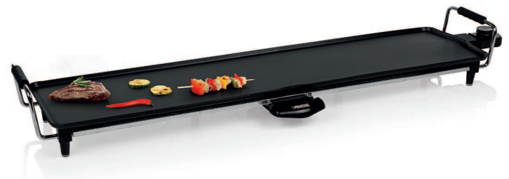
Table Chef XL 01.102327.01.001

PARTS DESCRIPTION / ONDERDELENBESCHRIJVING / DESCRIPTION DES PIÈCES / TEILEBESCHREIBUNG / DESCRIPCIÓN DE LAS PIEZAS / DESCRIÇÃO DOS COMPONENTES / DESCRIZIONE DELLE PARTI / BESKRIVNING AV DELAR / OPIS CZĘŚCI / POPIS SOUČÁSTÍ / POPIS SUČASTÍ / ОПИСАНИЕ ЗАПЧАСТИ