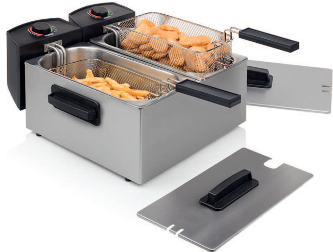
Double Fryer 01.183123.01.001

PARTS DESCRIPTION / ONDERDELENBESCHRIJVING / DESCRIPTION DES PIÈCES / TEILEBESCHREIBUNG / DESCRIPCIÓN DE LAS PIEZAS / DESCRIÇÃO DOS COMPONENTES / DESCRIZIONE DELLE PARTI / BESKRIVNING AV DELAR / OPIS CZĘŚCI / POPIS SOUČÁSTÍ / POPIS SOUČASTI / ОПИСАНИЕ ЗАПЧАСТИ