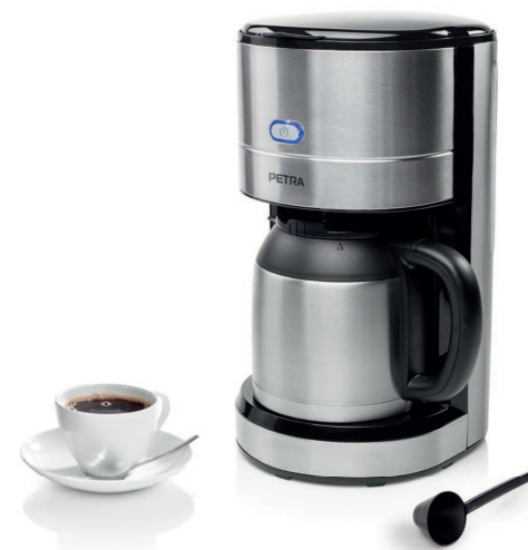
COFFEE MAKER ISO KM 54.57

PARTS DESCRIPTION / ONDERDELENBESCHRIJVING / DESCRIPTION DES PIÈCES / TEILEBESCHREIBUNG / DESCRIPCIÓN DE LAS PIEZAS / DESCRIÇÃO DOS COMPONENTES / DESCRIZIONE DELLE PARTI / BESKRIVNING AV DELAR / OPIS CZĘŚCI / POPIS SOUČÁSTÍ / POPIS SUČASTI