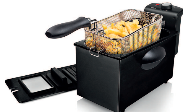
DEEP FRYER BLACK 02.180705.01.001

PT Manual de utilizador SV Bruksanvisning PL Instrukcja obsługi CS Návod na použití SK Návod na použitie