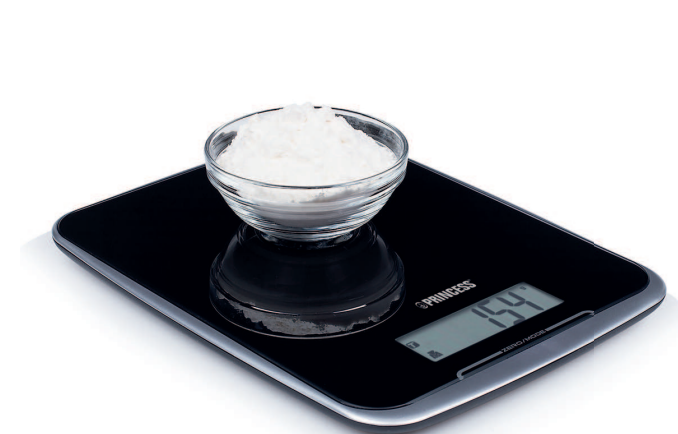
Kitchen Scale 01.492958.01.001

PARTS DESCRIPTION / ONDERDELENBESCHRIJVING / DESCRIPTION DES PIÈCES / TEILEBESCHREIBUNG / DESCRIPCION DE LAS PIEZAS / DESCRIÇÃO DOS COMPONENTES / DESCRIZIONE DELLE PARTI / BESKRIVNING AV DELAR / OPIS CZĘŚCI / POPIS SOUČÁSTÍ / POPIS SOUČASTI