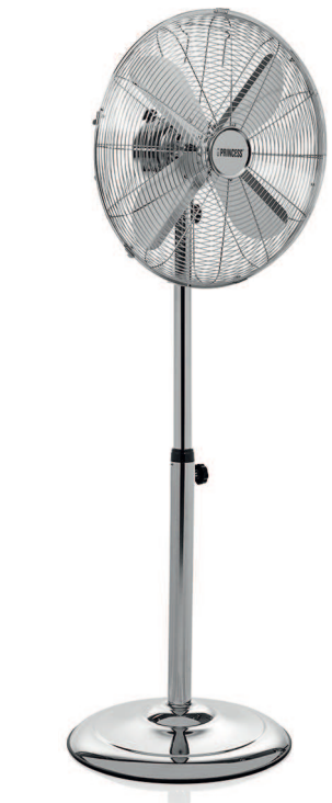
Metal stand fan 01.355951.01.001

PARTS DESCRIPTION / ONDERDELENBESCHRIJVING / DESCRIPTION DES PIÈCES / TEILEBESCHREIBUNG / DESCRIPCION DE LAS PIEZAS / DESCRICÃO DOS COMPONENTES / DESCRIZIONE DELLE PARTI / BESKRIVNING AV DELAR / OPIS CZĘŚCI / POPIS SOUČÁSTÍ / POPIS SUČASTI / RÉSZEGYSÉGEK LEÍRÁSA / OPIS SESTAVNIH DELOV