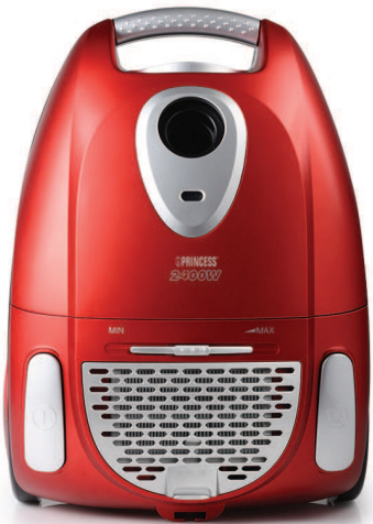
Vacuum cleaner 01.334100.01.001

PARTS DESCRIPTION / ONDERDELENBESCHRIJVING / DESCRIPTION DES PIÉCES / TEILEBESCHREIBUNG / DESCRIPCION DE LAS PIEZAS / DESCRIZIONE DOS COMPONENTES / OPIS CZĘŚCI / DESCRIZIONE DELLE PARTI / BESKRIVNING AV DELAR / POPIS SOUČÁSTÍ / POPIS SÚČASTÍ