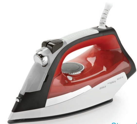
Steam Iron 01.322740.01.001

PARTS DESCRIPTION / ONDERDELENBESCHRIJVING / DESCRIPTION DES PIÉCES / TEILEBESCHREIBUNG / DESCRIPCION DE LAS PIEZAS / DESCRIÇÃO DOS COMPONENTES / OPIS CZĘŚCI / DESCRIZIONE DELLE PARTI / BESKRIVNING AV DELAR / POPIS SOUČÁSTÍ / POPIS SÚČASTÍ