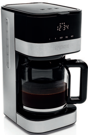
Coffee maker Lucca 01.246011.01.001

PARTS DESCRIPTION / ONDERDELENBESCHRIJVING / DESCRIPTION DES PIÈCES / TEILEBESCHREIBUNG / DESCRIPCION DE LAS PIEZAS / DESCRIÇÃO DOS COMPONENTES / DESCRIZIONE DELLE PARTI / BESKRIVNING AV DELAR / OPIS CZĘŚCI / POPIS SOUČÁSTÍ / POPIS SUČASTI / ОПИСАНИЕ ЗАПЧАСТИ