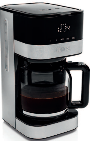
Coffee maker Lucca 01.246011.01.001

PARTS DESCRIPTION / ONDERDELENBESCHRIJVING / DESCRIPTION DES PIÈCES / TEILEBESCHREIBUNG / DESCRIPCION DE LAS PIEZAS / DESCRIÇÃO DOS COMPONENTES / DESCRIZIONE DELLE PARTI / BESKRIVNING AV DELAR / OPIS CZĘŚCI / POPIS SOUČÁSTÍ / POPIS SOUČASTÍ / ОПИСАНИЕ ЗАПЧАСТІ