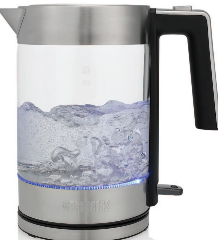
Glass kettle London 01.236041.01.001

PARTS DESCRIPTION / ONDERDELENBESCHRIJVING / DESCRIPTION DES PIÈCES / TEILEBESCHREIBUNG / DESCRIPCIÓN DE LAS PIEZAS / DESCRIÇÃO DOS COMPONENTES / DESCRIZIONE DELLE PARTI / BESKRIVNING AV DELAR / OPIS CZĘŚCI / POPIS SOUČÁSTI / POPIS SUČASTI / ОПИСАНИЕ ЗАПЧАСТИ