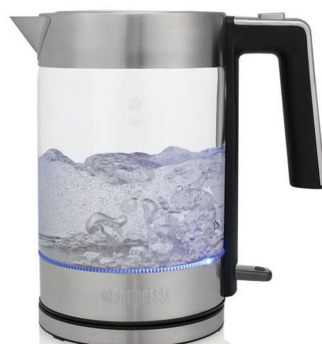
Glass kettle London 01.236041.01.001

PARTS DESCRIPTION / ONDERDELENBESCHRIJVING / DESCRIPTION DES PIÈCES / TEILEBESCHREIBUNG / DESCRIPCIÓN DE LAS PIEZAS / DESCRIZIONE DELLE PARTI / BESKRIVNING AV DELAR / OPIS CZĘŚCI / POPIS SOUČÁSTI / POPIS SUČASTI / ОПИСАНИЕ ЗАПЧАСТИ