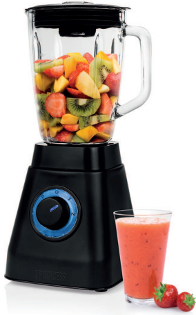
Black Steel Blender 01.212085.01.001

PARTS DESCRIPTION / ONDERDELENBESCHRIJVING / DESCRIPTION DES PIÉCES / TEILEBESCHREIBUNG / DESCRIPCIÓN DE LAS PIEZAS / DESCRIÇÃO DOS COMPONENTES / DESCRIZIONE DELLE PARTI / BESKRIVNING AV DELAR / OPIS CZĘŚCI / POPIS SOUČÁSTÍ / POPIS SUČASTI / ОПИСАНИЕ ЗАПЧАСТИ