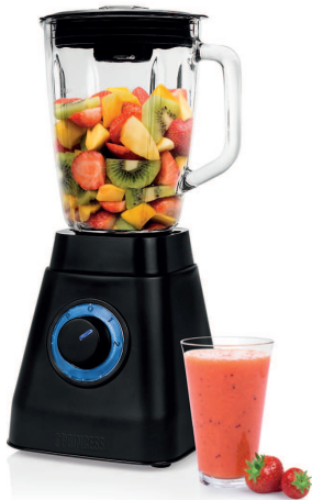
Black Steel Blender 01.212085.01.001

PARTS DESCRIPTION / ONDERDELENBESCHRIJVING / DESCRIPTION DES PIÈCES / TEILEBESCHREIBUNG / DESCRIPCIÓN DE LAS PIEZAS / DESCRIÇÃO DOS COMPONENTES / DESCRIZIONE DELLE PARTI / BESKRIVNING AV DELAR / OPIS CZĘŚCI / POPIS SOUČÁSTI / POPIS SUČASTI / ОПИСАНИЕ ЗАПЧАСТИ