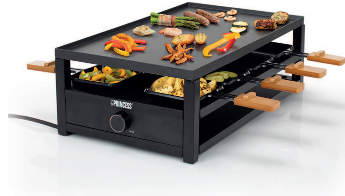
BLACK STEEL Raclette 01.162655.01.001

PARTS DESCRIPTION / ONDERDELENBESCHRIJVING / DESCRIPTION DES PIÈCES / TEILEBESCHREIBUNG / DESCRIPCIÓN DE LAS PIEZAS / DESCRICÃO DOS COMPONENTES / DESCRIZIONE DELLE PARTI / BESKRIVNING AV DELAR / OPIS CZĘŚCI / POPIS SOUČÁSTÍ / POPIS SÚČASTÍ