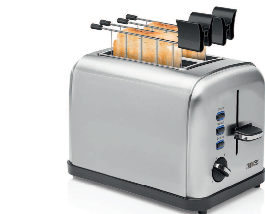
Toaster Steel Style 2 01.142354.24.001

PARTS DESCRIPTION / ONDERDELENBESCHRIJVING / DESCRIPTION DES PIÈCES / TEILEBESCHREIBUNG / DESCRIPCION DE LAS PIEZAS / DESCRIÇÃO DOS COMPONENTES / DESCRIZIONE DELLE PARTI / BESKRIVNING AV DELAR / OPIS CZĘŚCI / POPIS SOUČÁSTÍ / POPIS SOUČASTI / BESKRIVELSE AV DELER