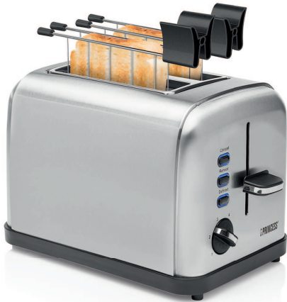
Toaster Steel Style 2 01.142354.24.001

PARTS DESCRIPTION / ONDERDELENBESCHRIJVING / DESCRIPTION DES PIÈCES / TEILEBESCHREIBUNG / DESCRIPCION DE LAS PIEZAS / DESCRICÃO DOS COMPONENTES / DESCRIZIONE DELLE PARTI / BESKRIVNING AV DELAR / OPIS CZĘŚCI / POPIS SOUČÁSTÍ / POPIS SOUČASTI / BESKRIVELSE AV DELER