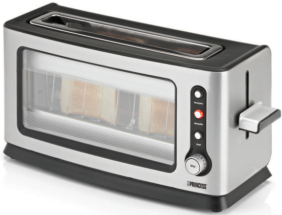
Toaster Window Deluxe 01.142351.09.001