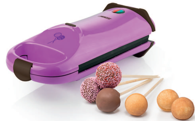
Cake pop maker 01.132403.09.001