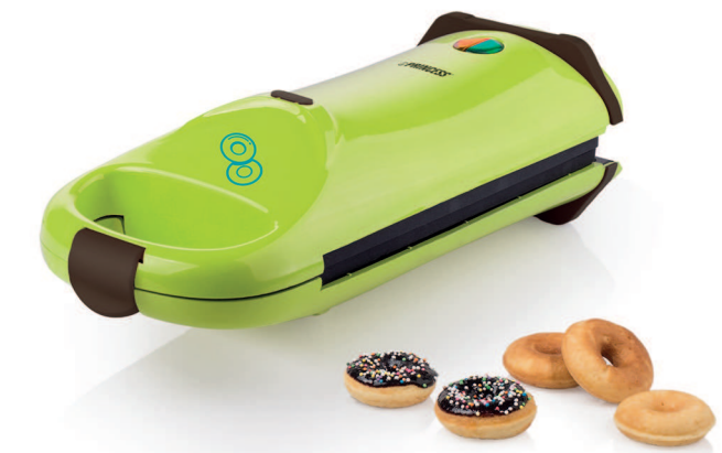
Roundy Maker 01.132402.04.001