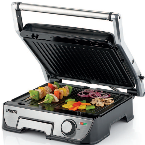
Contact Grill 01.12505.01.001

PARTS DESCRIPTION / ONDERDELENBESCHRIJVING / DESCRIPTION DES PIÈCES / TEILEBESCHREIBUNG / DESCRIPCION DE LAS PIEZAS / DESCRIÇÃO DOS COMPONENTES / DESCRIZIONE DELLE PARTI / BESKRIVNING AV DELAR / OPIS CZĘŚCI / POPIS SOUČÁSTÍ / POPIS SOUČASTÍ