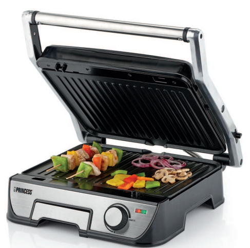
Contact Grill 01.112505.01.001

PARTS DESCRIPTION / ONDERDELENBESCHRIJVING / DESCRIPTION DES PIÈCES / TEILEBESCHREIBUNG / DESCRIPCIÓN DE LAS PIEZAS / DESCRIÇÃO DOS COMPONENTES / DESCRIZIONE DELLE PARTI / BESKRIVNING AV DELAR / OPIS CZĘŚCI / POPIS SOUČÁSTÍ / POPIS SÚČASTÍ