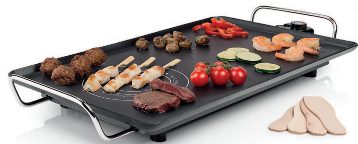
Table Chef Hot-zone XXL 01.103051.01.002

PARTS DESCRIPTION / ONDERDELENBESCHRIJVING / DESCRIPTION DES PIÈCES / TEILEBESCHREIBUNG / DESCRIPCIÓN DE LAS PIEZAS / DESCRIÇÃO DOS COMPONENTES / DESCRIZIONE DELLE PARTI / BESKRIVNING AV DELAR / OPIS CZĘŚCI / POPIS SOUČÁSTÍ / POPIS SUČASTI / BESKRIVELSE AV DELER