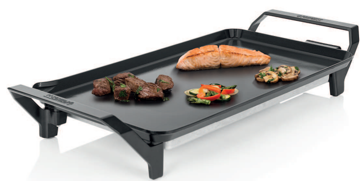
Table Chef Premium XL Black 01.100410.01.001

PARTS DESCRIPTION / ONDERDELENBESCHRIJVING / DESCRIPTION DES PIÈCES / TEILEBESCHREIBUNG / DESCRIPCIÓN DE LAS PIEZAS / DESCRIÇÃO DOS COMPONENTES / DESCRIZIONE DELLE PARTI / BESKRIVNING AV DELAR / OPIS CZĘŚCI / POPIS SOUČÁSTÍ / POPIS SUČASTÍ / ОПИСАНИЕ ЗАПЧАСТЕЙ