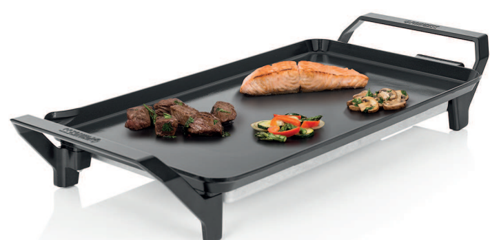
Table Chef Premium XL Black 01.100410.01.001

PARTS DESCRIPTION / ONDERDELENBESCHRIJVING / DESCRIPTION DES PIÈCES / TEILEBESCHREIBUNG / DESCRIPCIÓN DE LAS PIEZAS / DESCRIÇÃO DOS COMPONENTES / DESCRIZIONE DELLE PARTI / BESKRIVNING AV DELAR / OPIS CZĘŚCI / POPIS SOUČÁSTI / POPIS SUČASTI / ОПИСАНИЕ ЗАПЧАСТИ